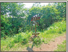
分岐点 ※山頂はすぐそこ