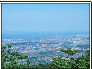
市街地が一望できる