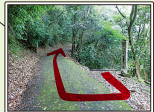
遊歩道終点 ※ここからは舗装道を登る