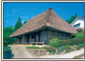
国指定重要文化財 「後藤家住宅」