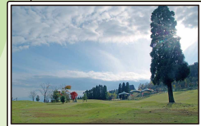
全国植樹祭記念広場