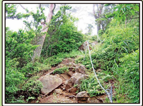
急な階段 急なほりには鎖が整備されている