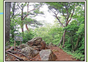
なだらかな尾根を歩く。松と岩がきれい