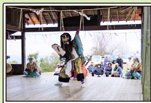
大分市指定無形民俗文化財 深山流伊与床神楽

山頂及びその周辺は天面山森林公園として整備され、眺望もよい。また、五柱神社に伝わる、深山流伊与床神楽は大分市指定無形民俗文化財として、明治時代より継承されている。